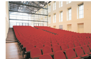
3. Sala Plenaria