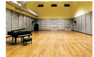
4. Sala prove