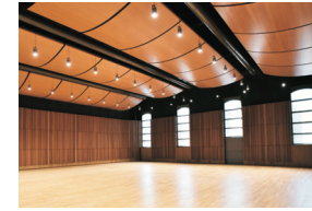
4. Sala Gavazzeni