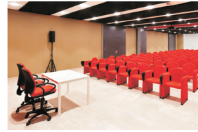
2. Sala Paër